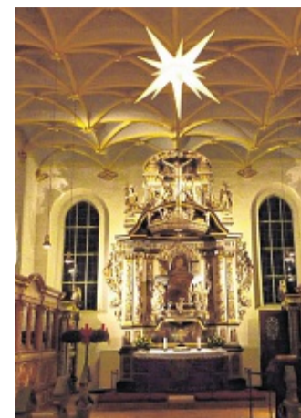
Das Konzert mit dem Gemischten Chor beschließt die Weihnachtszeit in der Schosskirche

Mit Unterstützung eines Streicherensembles erklingen Lieder aus vier Jahrhunderten. Die Chorleiterin wird auch diesmal, der Tradition folgend, zum Mitsingen einladen. Die Liedtexte, und bei weniger bekannten Liedern auch die Noten, haben sie vorbereitet. Der Eintritt ist frei. Am Ausgang wird um