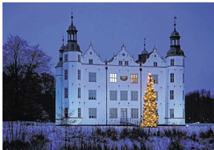
Weihnachten im Ahrensburger Schloss: Geöffnet ist am 23., 26. bis 28. sowie am 30. Dezember.