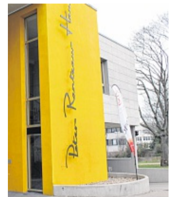
Peter-Rantzau-Haus