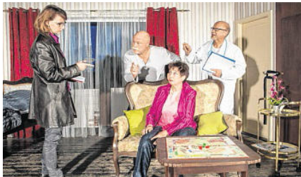
Turbulent geht es zu, wenn die Niederdeutsche Bühne Preetz im Alfred-Rust-Saal auftritt.