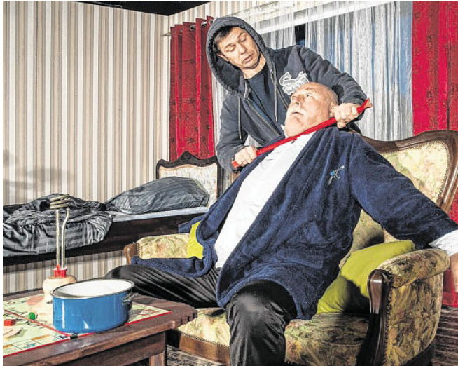
Was nun? Ausgerechnet bei Peter Fischer ist der Sträfling Kaminski untergeschlüpft.

Zu sehen ist diese rasante Komödie am Donnerstag, 26. Januar, und Freitag, 27. Januar, jeweils um 20 Uhr im Alfred-Rust-Saal an der Selma-Lagerlöf-Gemeinschaftsschule im Wulfsdorfer Weg 71. Die Karten kosten zwischen sieben und zwölf Euro und sind an den