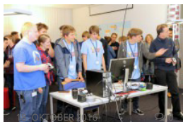
Erstes #hackathon bei der Basler AG: Programmieren lernen von und mit den Profis