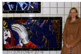
Galerie der Hände im Fußgängertunnel: Neues Mosaik glitzert in Gold