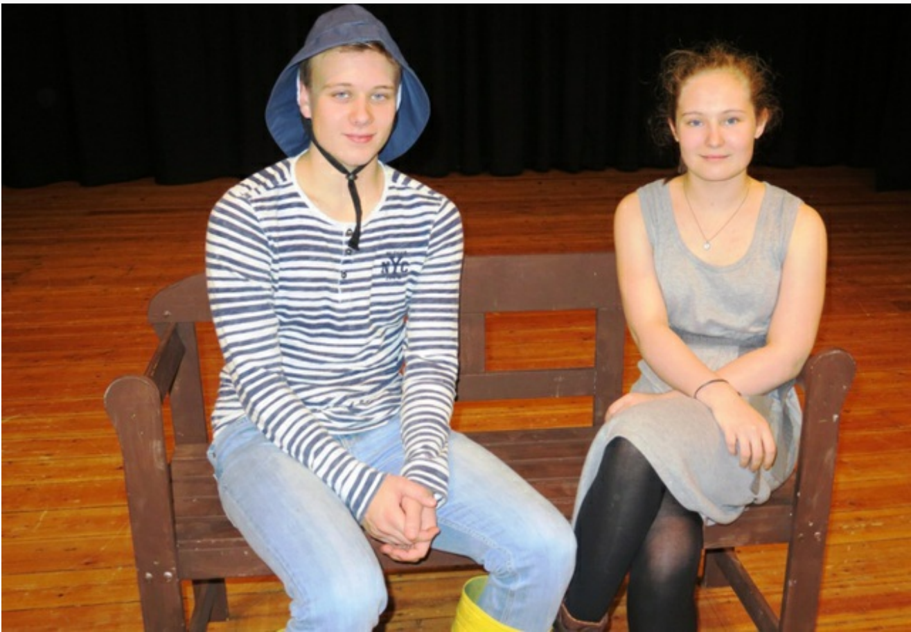
Der Fischer und seine Frau.

direkt am Meer wohnt und die herrlichsten Ausblicke auf das Meer und die Natur genießen kann. Zugegeben, die Hütte in der sie leben, ist sehr klein und auch nicht besonders komfortabel und wird von den Kindern im Dorf immer "Pisspott" genannt, aber sie ist gemütlich. Von dem Geld, das der Fischer Jan durch den Fischfang verdient, lässt sich kein neues großes Haus bauen, da das kleine Einkommen gerade zum Leben reicht. Aber Jan ist ein zufriedener Mensch und glücklich über jeden neuen Tag.