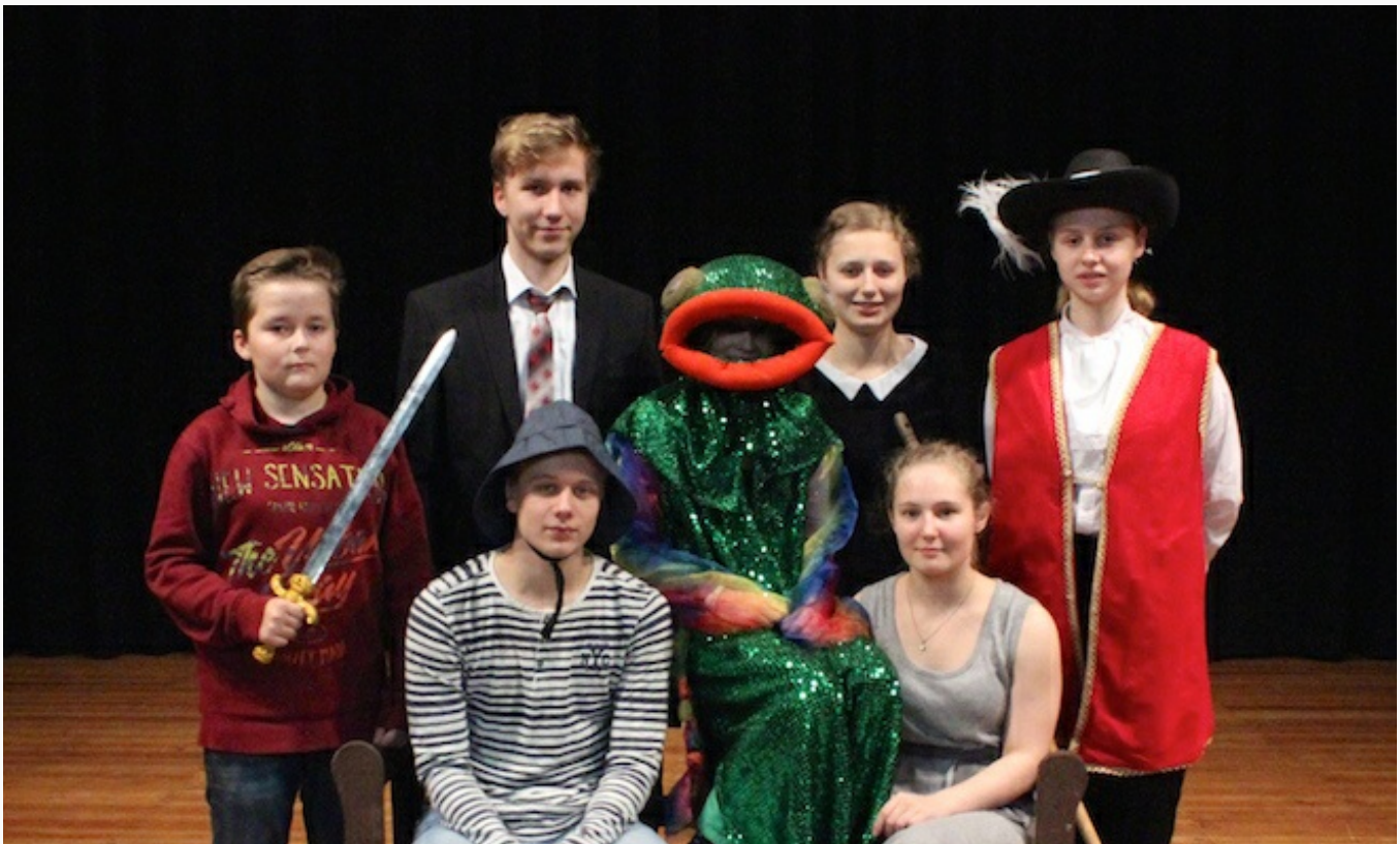
Das Ensemble Mimikri spielt “Vom Fischer und seiner Frau”.

Ahrensburg (je/pm). Kekse backen, Tannenbaum schmücken und der Besuch eines Weihnachtsmärchens sind unvergessliche Erlebnisse, die für Kinder zur Weihnachtszeit einfach dazugehören. Gelegenheit zum Theaterbesuch bietet das Weihnachtsmärchen “Vom Fischer und seiner Frau”, das die Theaterjugendgruppe Mimikri der Niederdeutschen Bühne Ahrensburg. Und vor allem: Die Kinder im Publikum dürfen, sollen und können mitspielen!